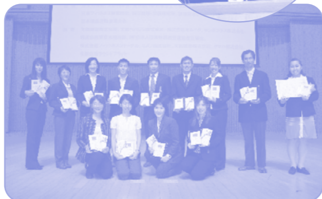
発表者は「優秀報告賞」として賞状と副賞が授与されます。