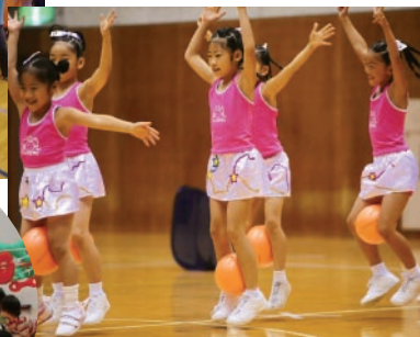
日本こどもフィットネス協会