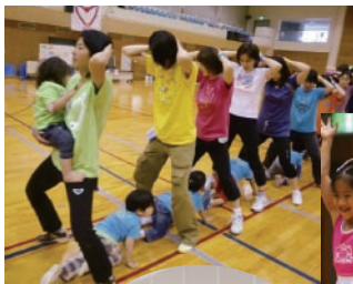
OKJ エアロビックファミリー

フィットネスサミットで健康づくりの方法と楽しさを学んでください。皆様のご参加を心よりお待ちしております。