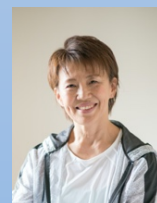
ファシリテーター

がんサバイバーのための運動支援の現場が抱える問題は多々あります。治療後の生活や人生の質を維持向上するために運動が果たす役割をどのように訴求するのか？また個々の身体やメンタルにどのように関わっていくのか・・・家族や周りどどのように協力していくのか・・・さまざまな問題に3人のパネリストの方にそれぞれの視点からその考え方や経験を語っていただきます。フィットネスの指導者の方にとって、がんサバイバーの方に運動指導することに不安や戸惑いがある方は、この機会により現場を知り、一歩踏み出す機会にしてください。